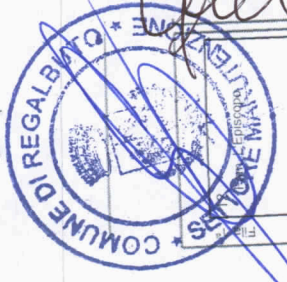
Riquadro D ampl