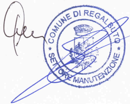
Riquadro E bis